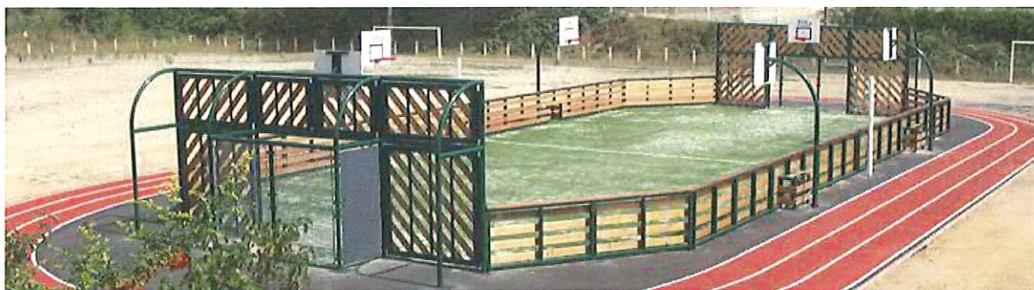
Un exemple de City Stade avec piste d'athlétisme en enrobé

Ce projet est également en lien avec l'école de Ceyrat d'Espartignac puisque notre jeunesse pourra disposer d'un équipement sportif multipratiques qui offrira les possibilités à nos intervenants sur le temps scolaire, périscolaire ou extrascolaire d'atteindre les objectifs éducatifs liés à la motricité, aux relations envers les autres ou à l'amélioration de sa santé.