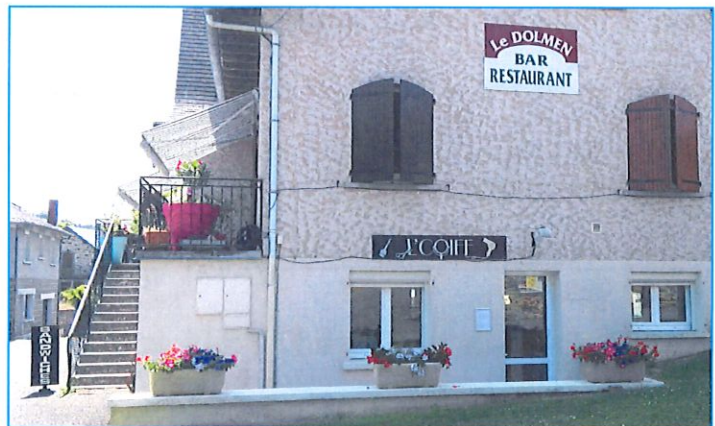
Restaurant « Le Dolmen » et salon de coiffure « L' Coiff » au bourg