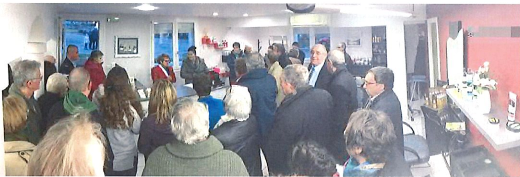
Inauguration salon de coiffure L' Coiff le 14 janvier 2017