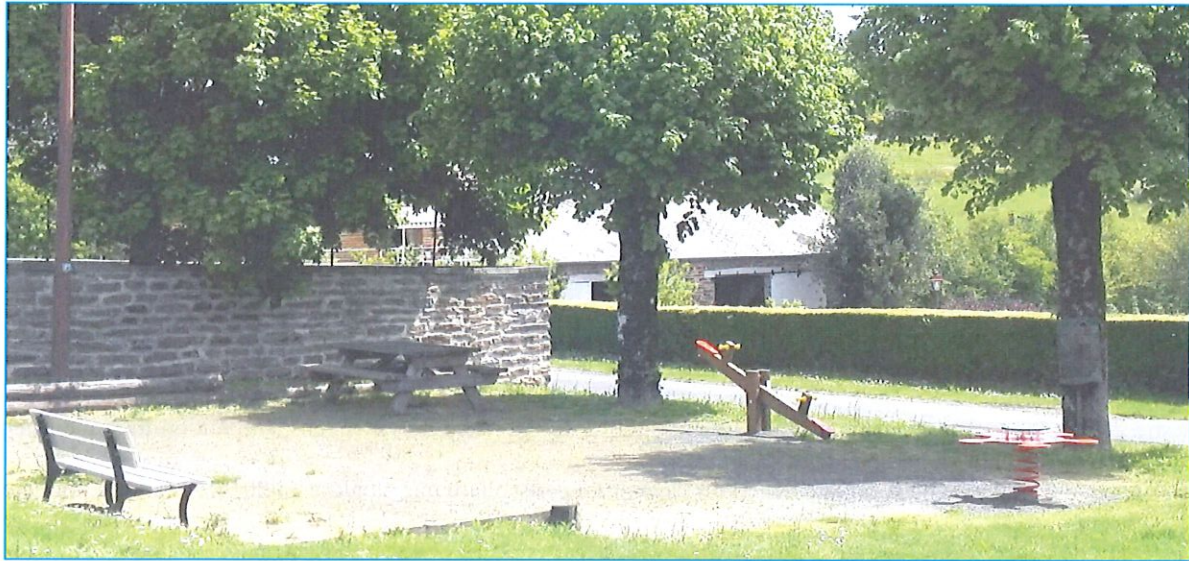
Jeux pour enfants , coin pique-nique et terrain de pétanque au bourg.